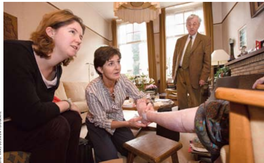
Volgens het Vektis-rapport steeg het aantal consulten in 2006 met zestien procent.

In het rapport blijven ook de extra administratieve kosten, waarmee de huisartsen werden opgezadeld bij de invoering van de zorgverzekeringswet onvermeld. Volgens onderzoek van de LHV en HuisartsVandaag is met die onkostenpost in 2006 een bedrag van zo'n 71 miljoen euro gemoeid. ■